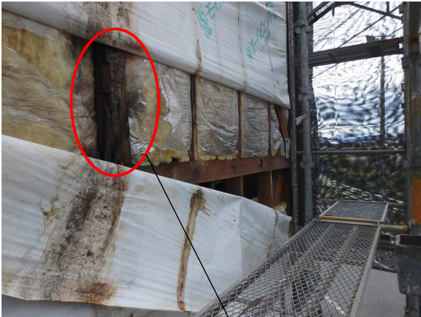
柱が腐っていました