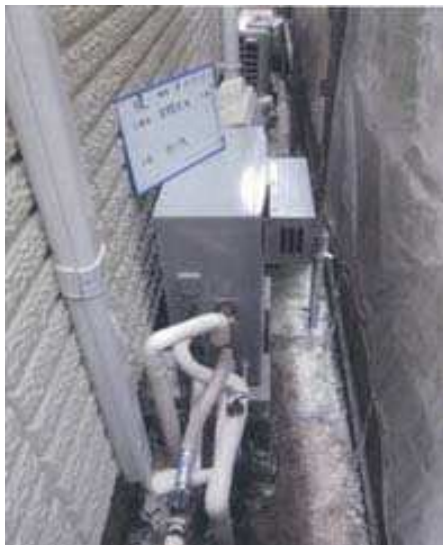
高効率給湯器の設置