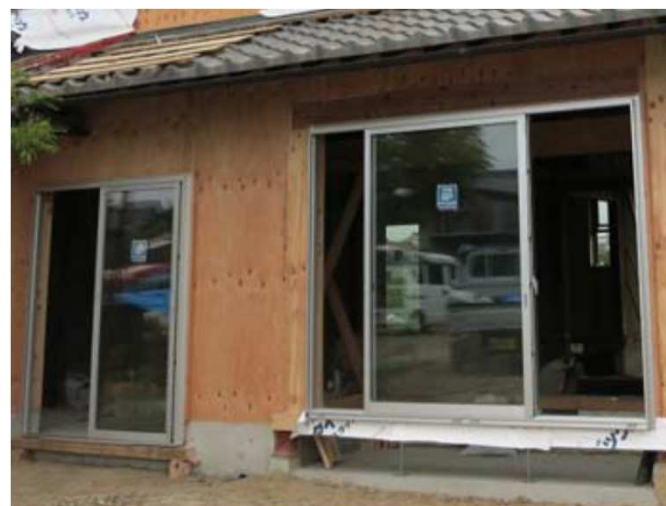
ペアガラスへの交換