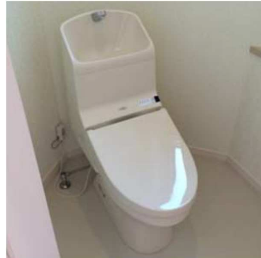
節水型トイレの設置